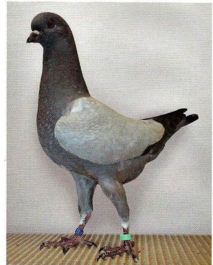
Züchterstolz und Champion von morgen – bestens veranlagter, 10 Wochen alter Schietti-Täuber in Blau ohne Binden

Backs-Gritmischungen und Futter von Beyers (Nr. 49) haben sich bewährt. „Gerste ist das Brot der Taube“, meint Rudi Baumann, der Sommer-, manchmal auch Wintergerste der Futtermischung zusetzt, ganzjährig mindestens 20 Prozent. Zuchttiere erhalten vor der Zuchtzeit pure Gerste zur Entschlackung, um direkt anschließend mit einer hochwertigen Mischung in Zuchtform gebracht zu werden. Auf ähnliche Weise bereitet Rudi