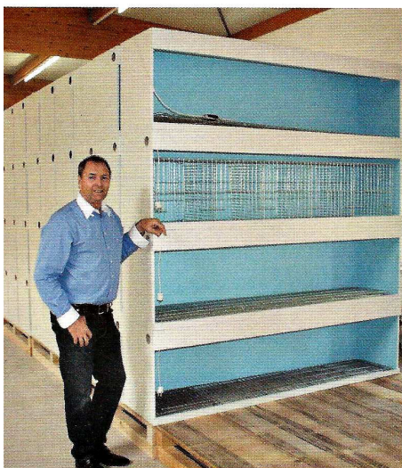
500 beleuchtete Käfige in der Halle