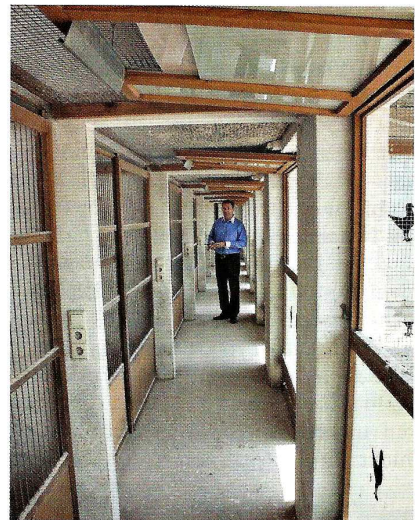
Praktischer Bedienungsgang mit Schiebetüren