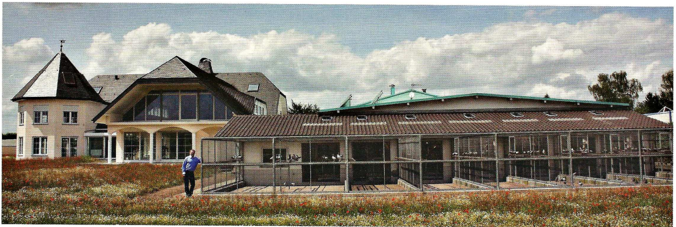
Zuchtanlage und Wohnhaus von Rudi Baumann in Waghäusel-Wiesental. Die große (Ausstellungs-)Halle steht hinter den Schlägen

Die direkt angrenzende große Halle, die ursprünglich als Lagerhalle eines Leder-großhandels diente, wird heute für Ausstellungen genutzt, aber auch als Stellplatz für