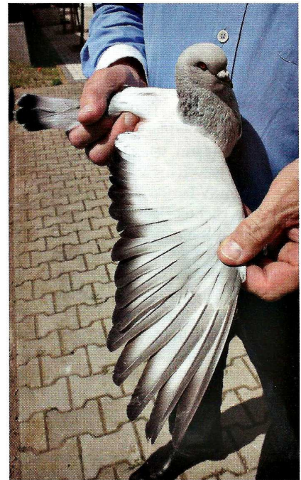
Eisfarbiger mit prima Farbe und Zeichnung

halten die Atemwege gesund. Rudi Baumann lässt den gesamten Bestand 4 Wochen vor den Schauen gegen Paramyxovirose impfen.