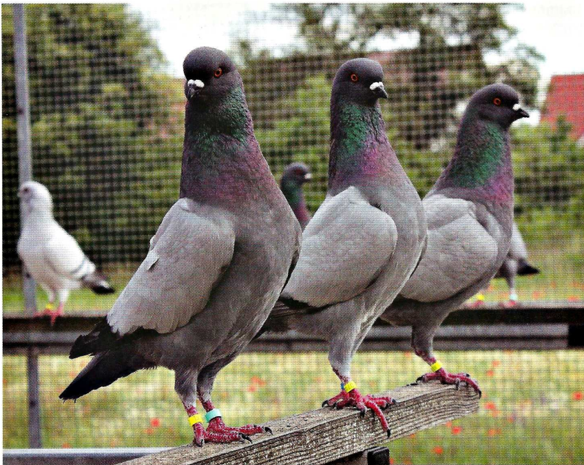
Erstklassige Schietti-Täuber in Blau ohne Binden. Kopf, Schnabeleinbau und Farbe bestechen