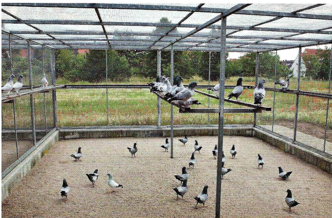
In sehr großen Volieren fühlen sich die Deutschen Modeneser sehr wohl