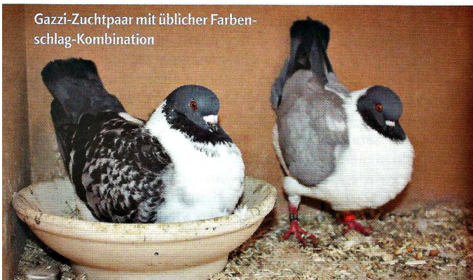
Gazzi-Zuchtpaar mit üblicher Farbschlag-Kombination

Comed- und Tollisan-Produkte unterstützen die Vitamin-Versorgung und ►