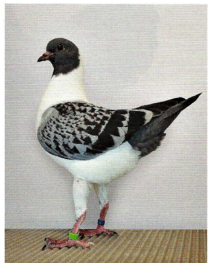
Gazzi-Täubin in Blaugehämmert