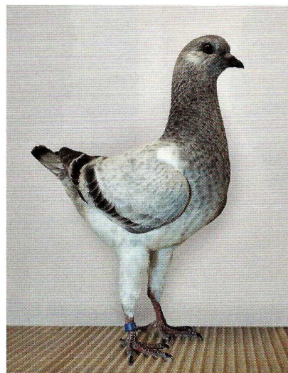
Junger Blauschimmel mit allen Vorzügen